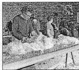
L'excellente qualité de la laine des brebis Mérinos.

moiteur et repousse les mauvaises odeurs. La Routo souhaite remettre l'exceptionnelle qualité de cette laine à l'honneur, développer dans les années à venir une gamme de vêtements techniques en laine mérinos d'Arles dans le domaine de la randonnée et de l'itinéraire.