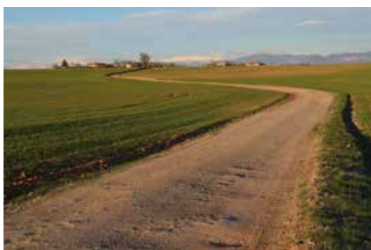
Draille des troupeaux d'Arles sur le plateau de Valensole

La Routo est issu de plus de dix ans d'échanges entre la Maison de la transhumance et l' Ecomuseo della pastorizia de Pontebernardo. Il a pour ambition la mise en œuvre et l'animation d'un itinéraire et d'un réseau transfrontaliers reliant la plaine de la Crau (Bouches-du-Rhône) à la vallée de la Stura (Italie), sur les traces des troupeaux ovins qui pratiquaient la grande transhumance estivale depuis les plaines de basse Provence jusqu'aux vallées alpines du Piémont.