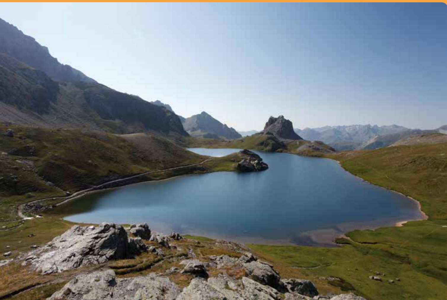
Alpes et lac du Roburent dans la vallée de la Stura