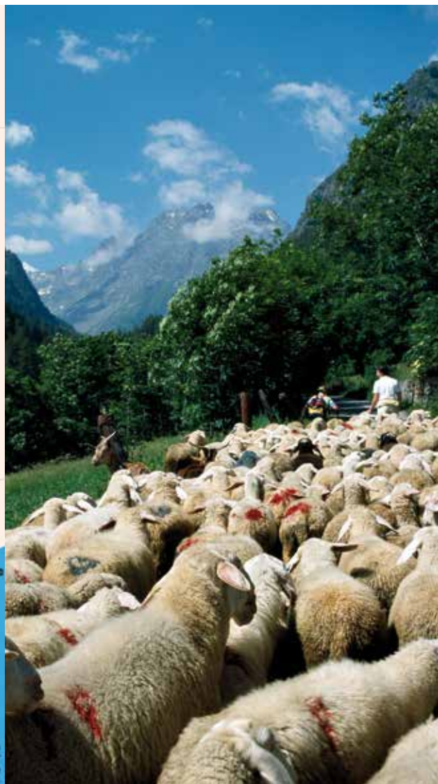
Amontagnage du troupeau de race sambucana de la famille Giordano, vallée de la Stura