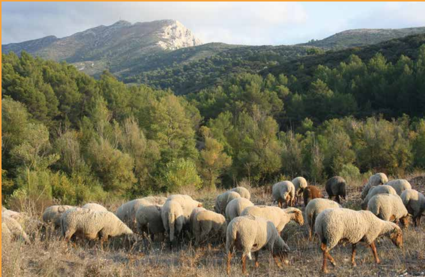
Troupeau de race mourérous de Bruno Salle, montagne Sainte-Victoire