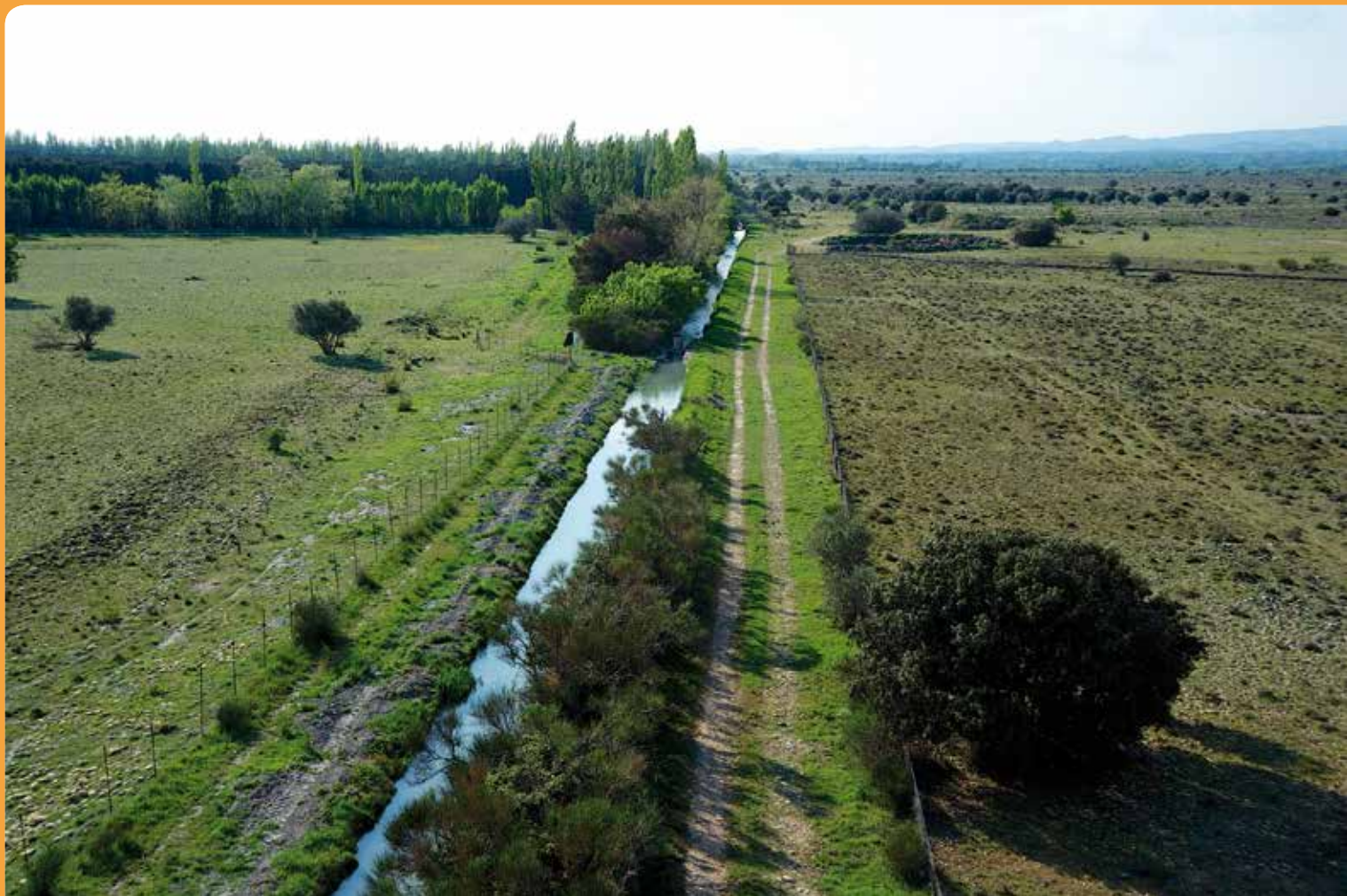
Carraire des troupeaux d'Arles, secteur du Merle à Salon-de-Provence