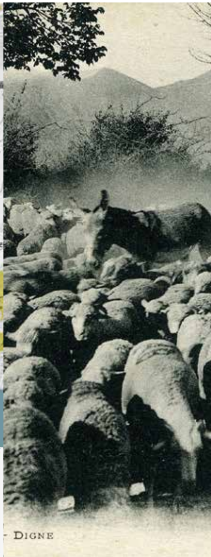
Anciennes drailles et carraires de transhumance