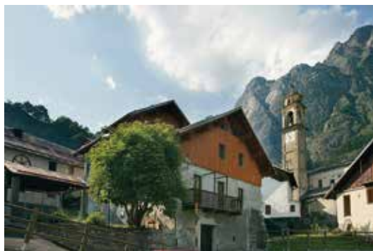
L'Ecomuseo della pastorizia, à Pontebernardo, pôle alpin de La Routo

L'Ecomuseo della pastorizia , inauguré en 2000 dans le village de Pontebernardo, situé à 1400 mètres d'altitude, en sera le pôle alpin. Le projet de l'Ecomuseo, sous l'égide de la Comunità Montana Valle Stura, se développe sur deux axes : d'une part, accompagner la valorisation de la race sambucana, race autochtone qui dans les années 1980 était menacée de disparition, d'autre part valoriser le patrimoine culturel du pastoralisme de la vallée de la Stura et ses relations étroites avec la plaine de la Crau.