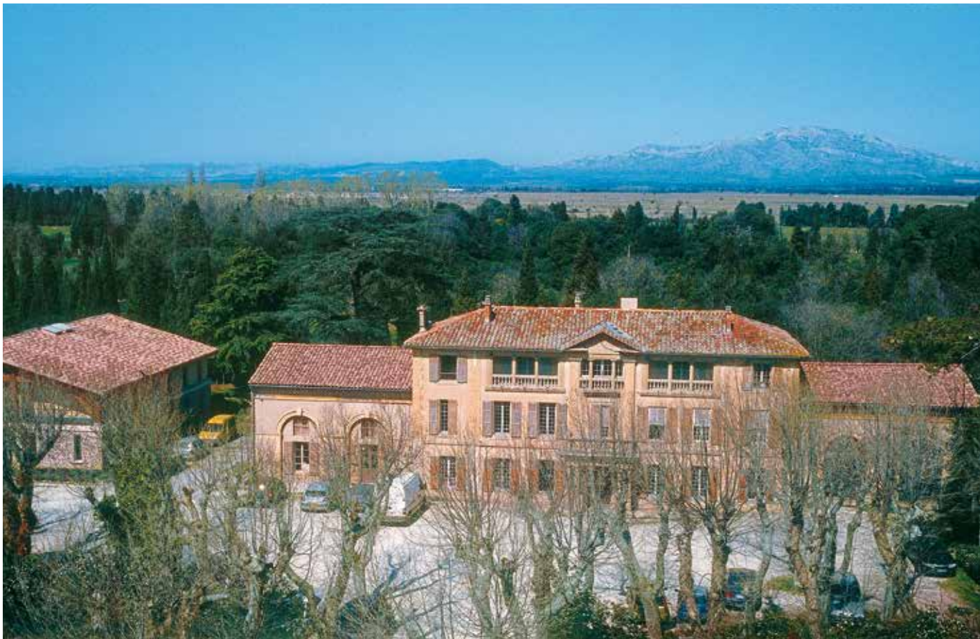
Le domaine du Merle, à Salon-de-Provence, pôle méridional de La Routo