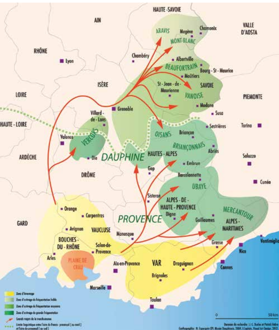
Grands sites actuels d'estivage des troupeaux transhumants provençaux