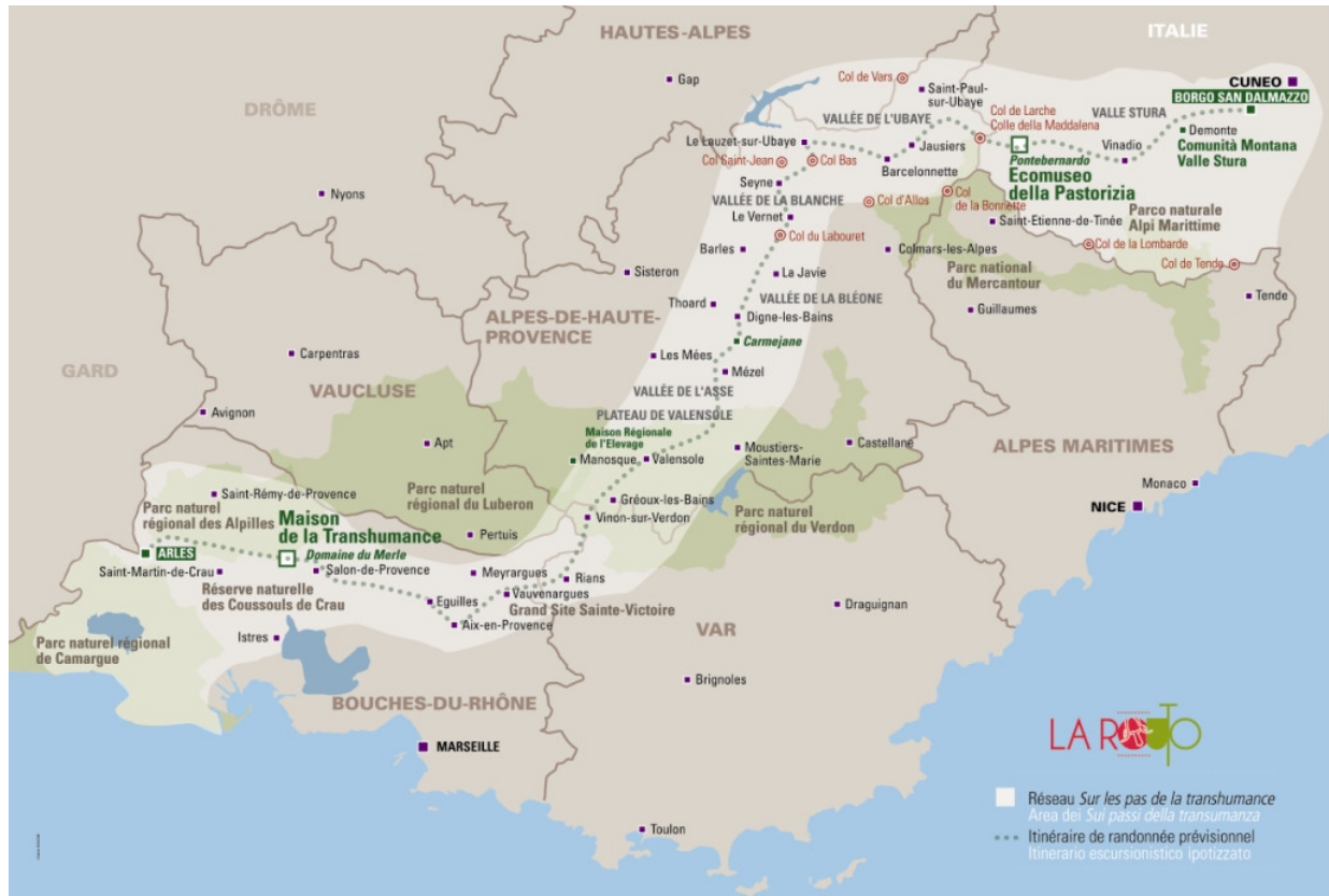
Itinéraire de randonnée prévisionnel et réseau LA ROUTO

Les enjeux de ce projet sont de valoriser les différents patrimoines liés à l'élevage pastoral et à la transhumance, et ainsi de renforcer l'identité rurale du territoire, qui est le thème principal du programme LEADER Pays d'Arles. Il s'inscrit notamment dans les axes stratégiques de développement territorial du Parc naturel régional des Alpilles, ainsi que de ses partenaires institutionnels et associatifs. Le projet investit plusieurs filières pour la valorisation des patrimoines naturels et culturels au profit des acteurs du monde économique, mais également du grand public dans le cadre d'activités de loisirs et de pleine nature respectueuses de l'environnement, des plus jeunes par des activités pédagogiques et de la sensibilisation. Son calendrier de réalisation va de juin 2014 à mars 2015.