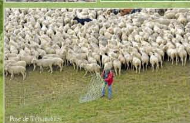
Pose de filets mobiles

Coût schématique par brebis d'une saison d'estive dans les Alpes du Sud en euros par brebis