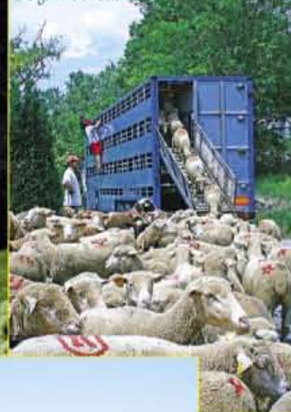
Chargement en bétail