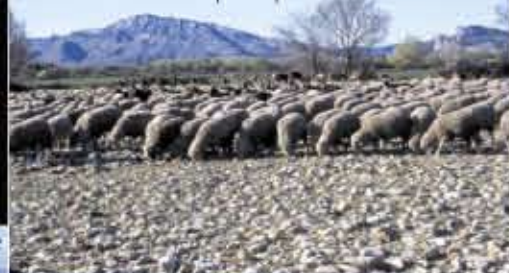
Plaine de la Crau - fin de printemps