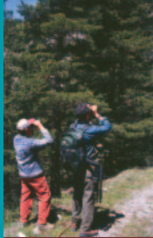
Randonneurs dans la pinède de Moriglione.