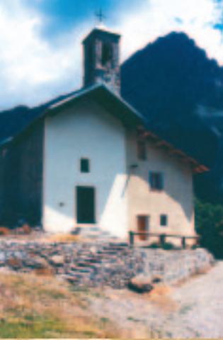
La Chapelle de San Lorenzo, sur le fond le Monte Bersaio.

Pontebernardo, siège de l'Écomusée du pastoralisme.