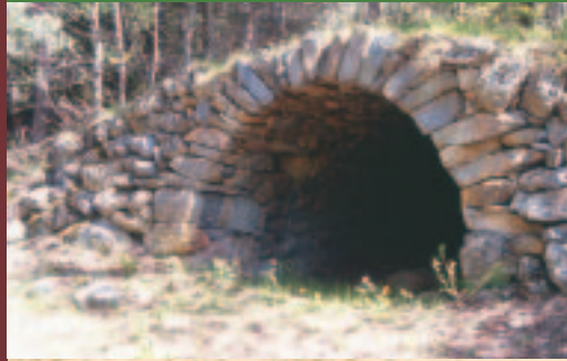
Abri, avec voûte en pierres, jadis utilisé par les bergers et les paysans.