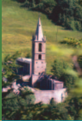
Le clocher roman des "Catre Loup" de Pietraporzio.